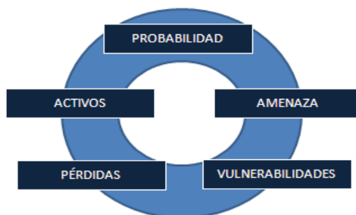
Figura 1 Elementos del Riesgo (Lara, 2012).

En la definición anterior se pueden identificar varios elementos que se deben comprender adecuadamente para entender integralmente el concepto de riesgo. Estos elementos son: probabilidad, amenazas, vulnerabilidades, activos y pérdidas, ver Figura 1.