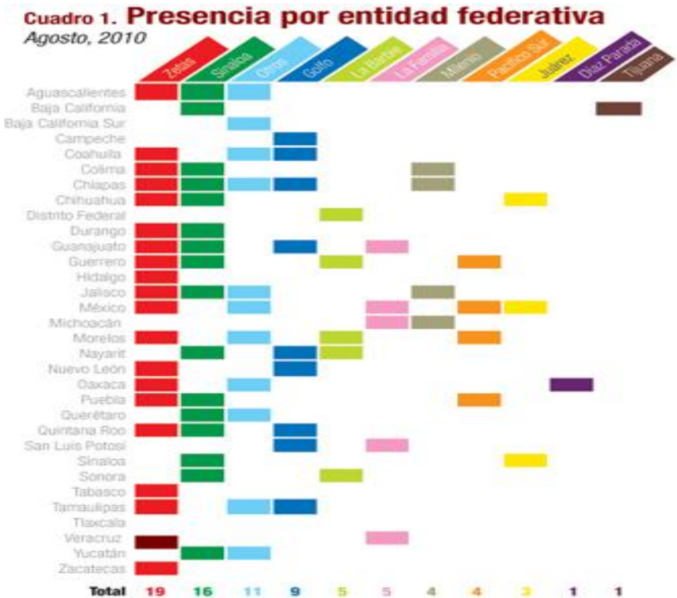
Cuadro 3 Presencia por entidad federativa