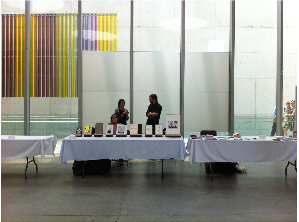
Muestra del Libro de Arte, MUAC. Abril 2018