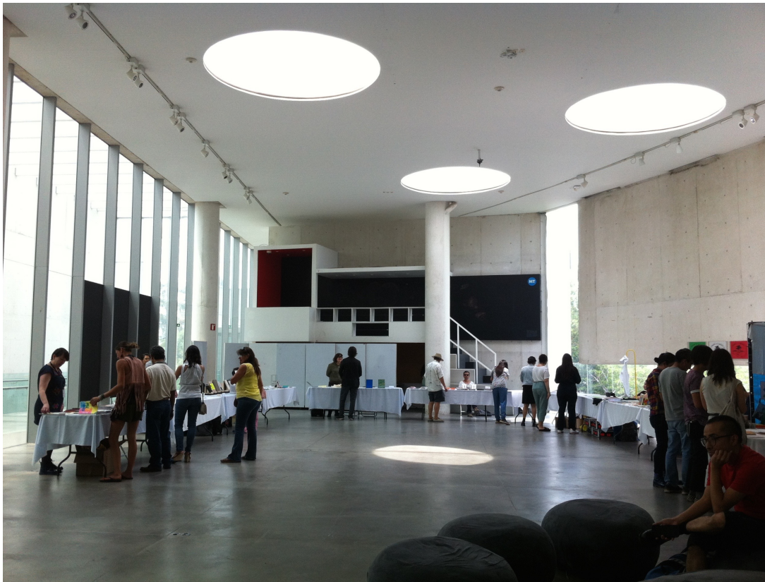
Muestra del Libro de Arte, MUAC. Abril 2018

Para él, es interesante el concepto de legibilidad, ya que en español no tenemos las equivalencias que tiene en inglés, en inglés hay dos palabras asociadas a legibilidad que es readability y legibility ; readability es mas nuestra noción de legibilidad algo que se puede leer, lo que es leíble que a su vez tiene que ver con lo que es comprensible que se puede traducir, parafrasear. Y legibility es una cuestión mas visual por ejemplo en un periódico como se distribuye la información si se pone el encabezado arriba abajo en letras chicas o grandes se trata mas de la visualidad del texto y si se traduce a esta diferencia entre libro objeto y libro como medio de comunicación tiene que ver con la legibilidad vista en esos dos aspectos legibilidad como algo visual y legibilidad como algo leíble.