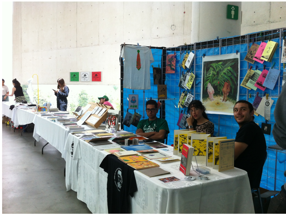
Muestra del Libro de Arte, MUAC. Abril 2018