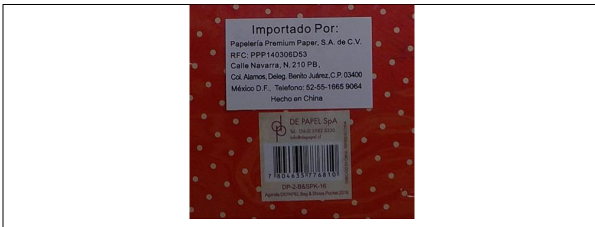
Imagen 3 Etiqueta de información comercial