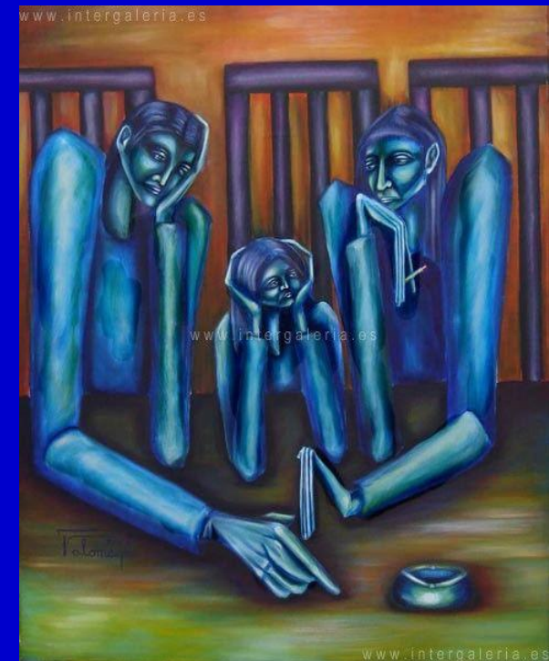
Oleos y Cuadros modernos y abstractos, Artistas Famosos - Oleos y Pinturas Obra Espera en Azul