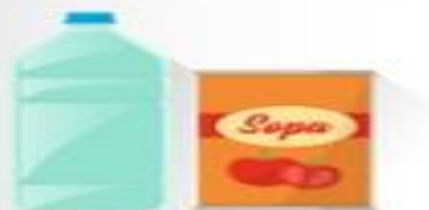
Bebidas y alimentos no perecibles