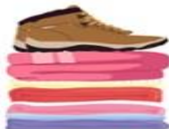
Ropa y abrigo