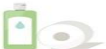
Artículos de higiene