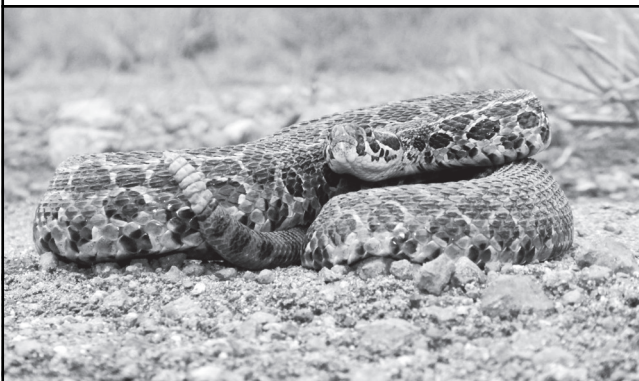
Figura 3. Serpiente de cascabel ocelada ( Crotalus polystictus ) en posición defensiva mientras mueve su cascabel (señal aposemática sonora).

Otro de los casos de aposematismo más interesantes entre los ofidios es el que caracteriza a la serpiente asiática Rhabdophis tigrinus . Esta especie, además de poseer un sistema de envenenamiento natural con pequeños colmillos posteriores fijos (opistoglifos) (Jackson, 2003; Silva et al. , 2014), también tiene una toxicidad adquirida a través del consumo de presas venenosas de las cuales retiene su veneno para posteriormente reutilizarlo (secuestro de toxinas). Su coloración dorsal amarilla, negra y roja del primer tercio corporal, está asociada a una inusual glándula ubicada sobre la superficie dorsal de su cuello (figura 4). Hutchinson et al. (2012) encontraron que estas glándulas nucales contienen toxinas esteroidales cardiotónicas llamadas bufadienolidos, las cuales son encontradas en la piel de sapos. Experimentos posteriores mostraron que la adquisición de estas toxinas en estas serpientes se debe al consumo de una de sus presas principales: el sapo de la especie Bufo japonicus (Hutchinson et al. , 2013). La capacidad de adquirir toxicidad mediante la absorción de compuestos tóxicos del alimento es muy común en términos de aposematismo y ha sido documentado en otros animales como las ranas arlequines del centro y sur de América, así como también en algunas aves de Nueva Guinea (Dumbacher et al. , 2004).