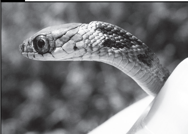
Figura 4. Cría de la serpiente tigre de dorso quillado ( Rhabdophis tigrinus ).

Nota: se observa la glándula nucal de bufadienolidos y la coloración dorsal de advertencia.