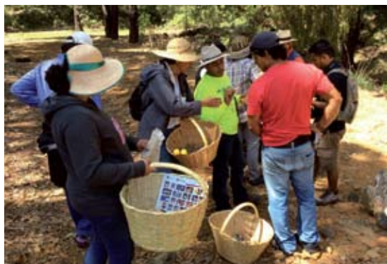
◀ FIGURA 8. Micoturistas en el Volcán de Tequila, Jalisco.