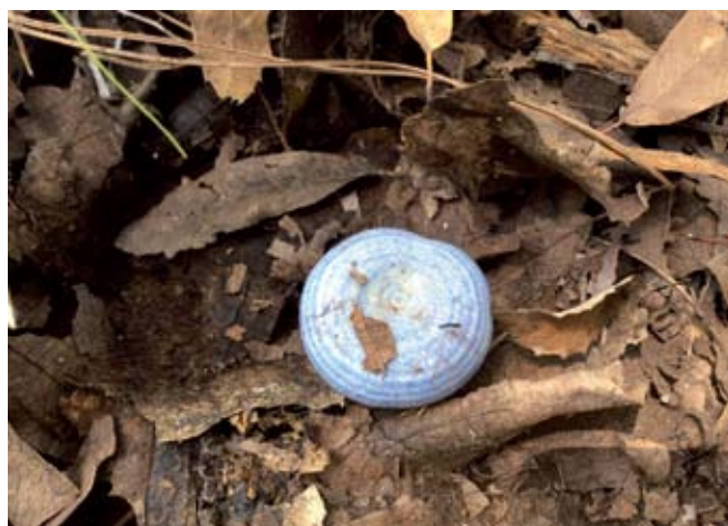
◀ FIGURA 4. Hongo Azul ( Lactarius indigo ) con un precio aproximado de 300 pesos kilo. Volcán de Tequila, Jalisco.

un gran conocimiento y precisión para su manejo, pues son organismos dependientes de otras especies, debido a su incapacidad fotosintética (figura 3). Además, tienen una gran importancia socioeconómica por sus usos alimentarios, medicinales y comerciales. Su recolección se asocia con unidades familiares, poseedoras de etnoconocimientos para su detección, manejo y utilización.