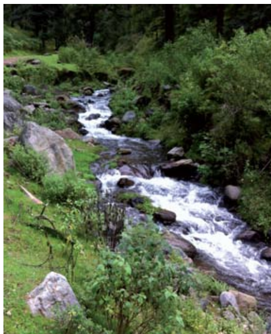
◀FIGURA 1. Paisaje boscoso y recursos hídricos en San Francisco Oxtotilpan, Estado de México.

Los bosques prestan servicios de regulación, aprovisionamiento y culturales; el turismo es la actividad más importante en el mundo, cuyos efectos económicos, sociales y ambientales son relevantes para las comunidades