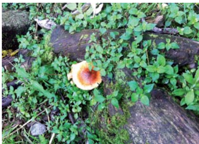
◀ FIGURA 3. Micrositio boscoso para la interacción de hongos y otras especies vegetales. San Francisco Oxtotilpan, Estado de México.