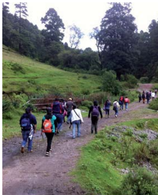
◀FIGURA 2. Prácticas turísticas en espacios forestales, San Francisco Oxtotilpan, Estado de México.