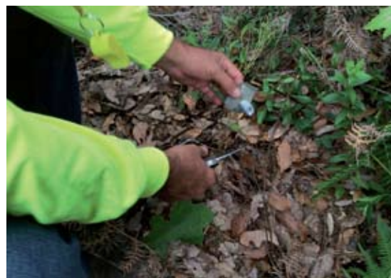
◀FIGURA 7. Buenas prácticas de recolección de HCS. Volcán de Tequila, Jalisco.