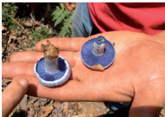
◀ FIGURA 9. Pareja de hongos azules ( Lactarius indigo ) Volcán de Tequila, Jalisco.

de México indicativos de que es una de las zonas más micodiversas del planeta, con paisajes de excepcional belleza, la cual cuenta con un sustrato cultural alimentario alrededor de los HCS.