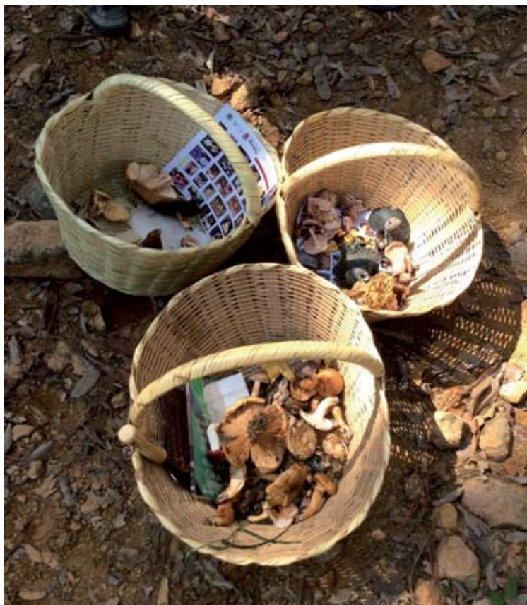
◀FIGURA 5. Canastos para recolección recreativa de hongos. Volcán de Tequila, Jalisco.