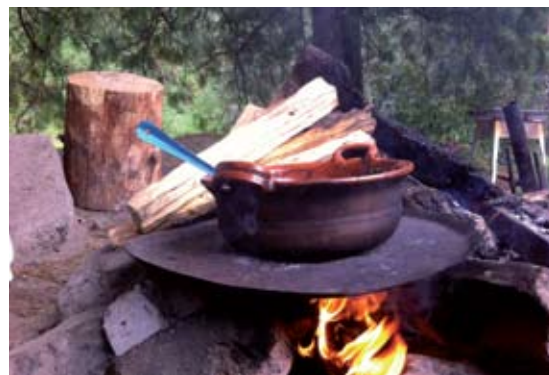
◀FIGURA 6. Fogón tradicional matlatzinca de hongos con quelites. San Francisco Oxtotilpan, Estado de México.