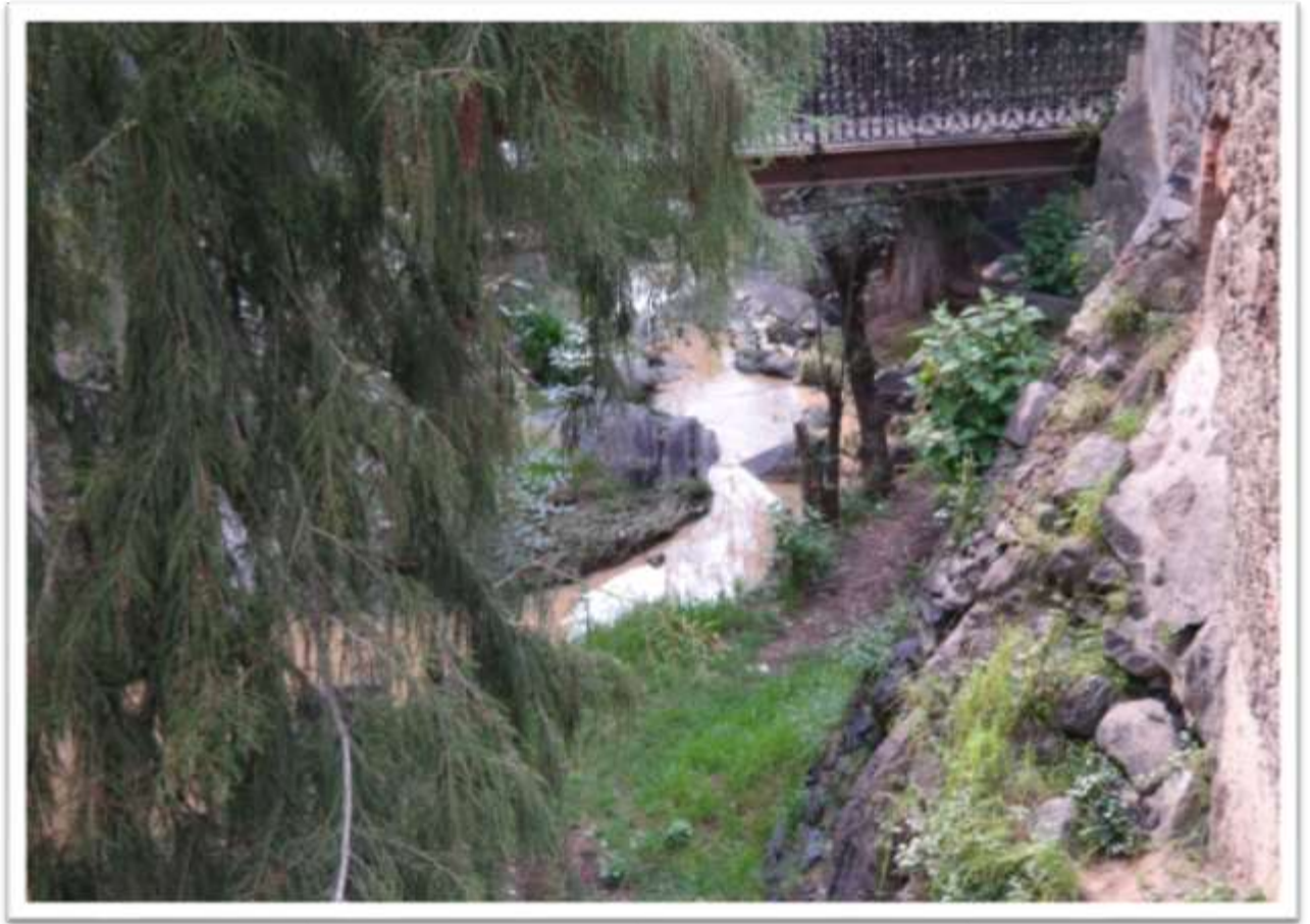
Figura 5.3 área de vegetación en el Molino de Flores.