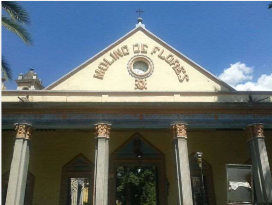
Figura 1.1. Portico de la Ex-hacienda Molino de Flores.