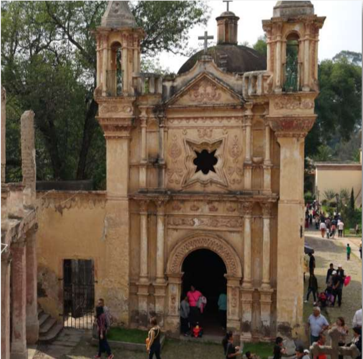
Figura 1.2 Capilla de San Joaquín