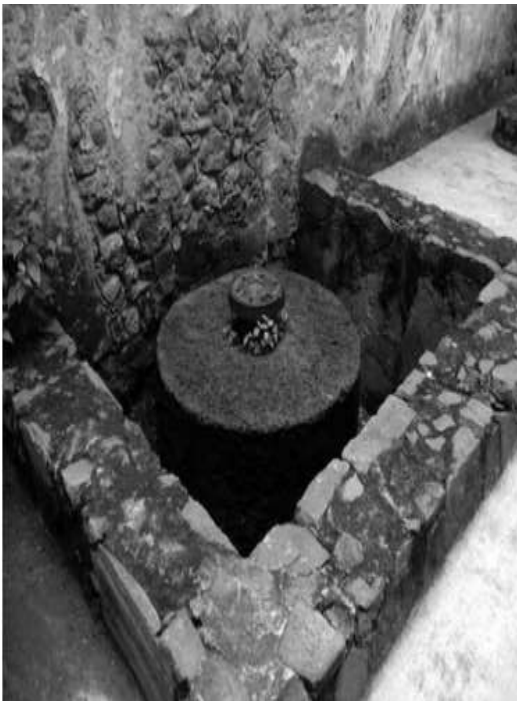
Figura. 4.3 Base fija del Molino de Trigo (PNMF)