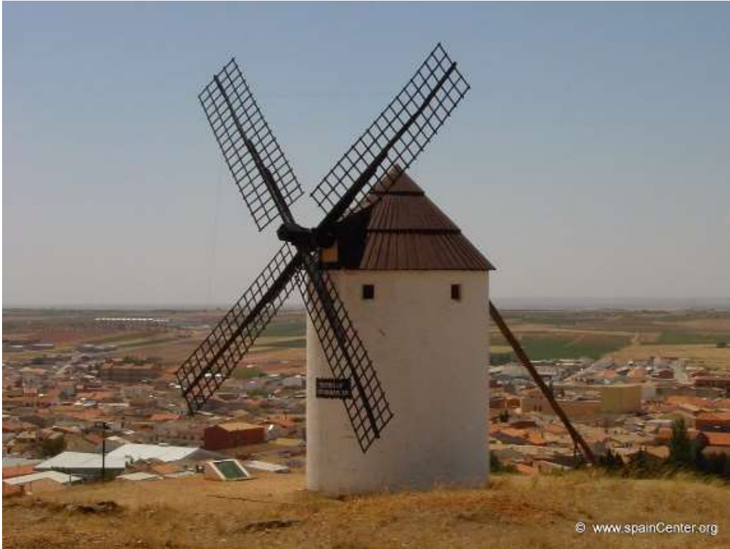
Figura 4.2 Molino de viento en Manchegos, Castilla la Mancha.