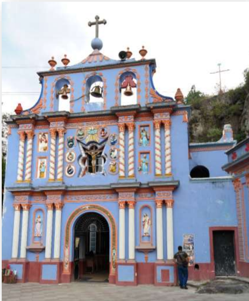
Figura 1.3 Capilla del señor de la Presa.