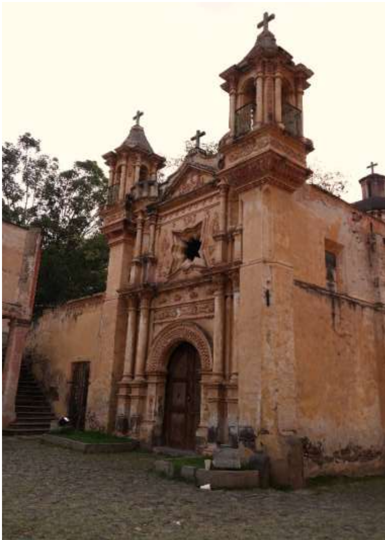
Figura 4.6 capilla de San Joaquín

Fuente: Fotografía de la autora, noviembre 2016.