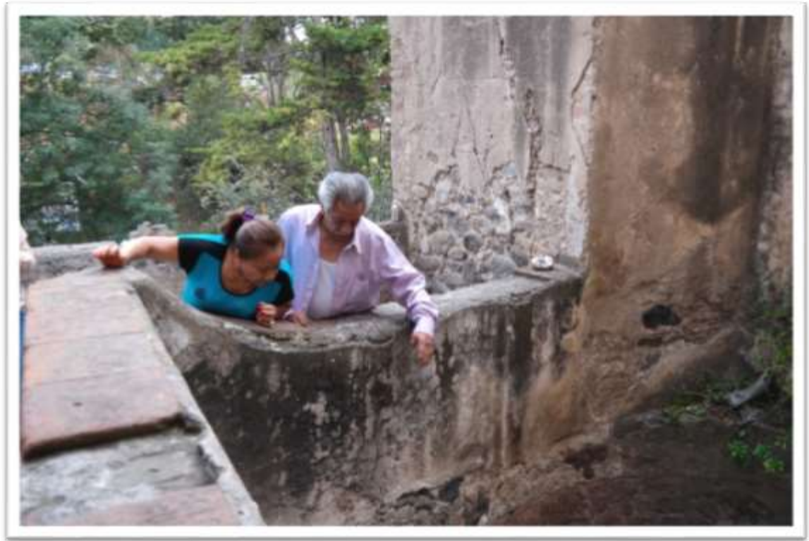
Figura 4.5 Personas platicando entre ellas “Aquí se molían las flores”.