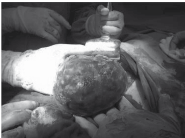
Figura 4 Masa encapsulada retirada por laparotomía.