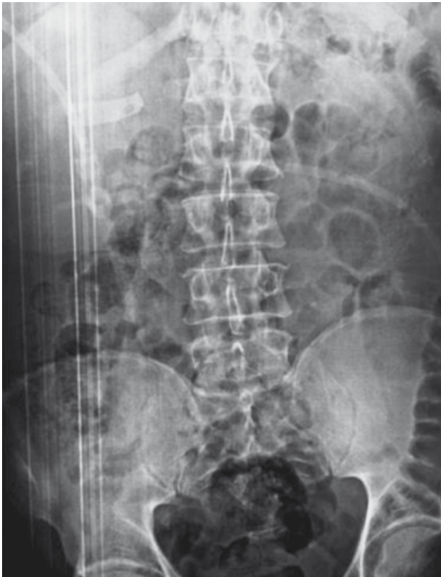
Figura 1 Radiografía simple de abdomen.

consecuencias serias en la salud del paciente, también para el profesional de salud y la institución a la que pertenecen 2 . Cualquier tipo de material utilizado durante la intervención quirúrgica puede ser olvidado; incluyendo esponjas, fórceps, piezas de instrumentos rotos, conjuntos de riego, tubos de goma, etc 3 . Sin embargo, las compresas y las gasas son el cuerpo extraño retenido más comúnmente encontrado y se estima que representan el 50% de las demandas por negligencia de cuerpos extraños, retenidos en alguna parte del cuerpo 4 .