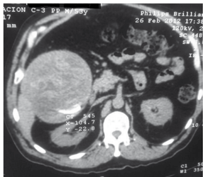
Figura 3 Tomografía de abdomen, corte transversal, que muestra cápsula hiperdensa con densidades heterogéneas en su interior.

pueden fistulizar a órganos adyacentes 9-11 . La reacción crónica, como el caso que nos atañe, suele ser de naturaleza aséptica y permanecer asintomático por mucho tiempo, encapsularse, formar adherencias y eventualmente un granuloma 4 . Se ha reportado en la literatura el hallazgo de neoplasias malignas como complicación crónica a la presencia de un textiloma, sin embargo el mecanismo por el cual se desarrolla aún es ignorado 12,13 .