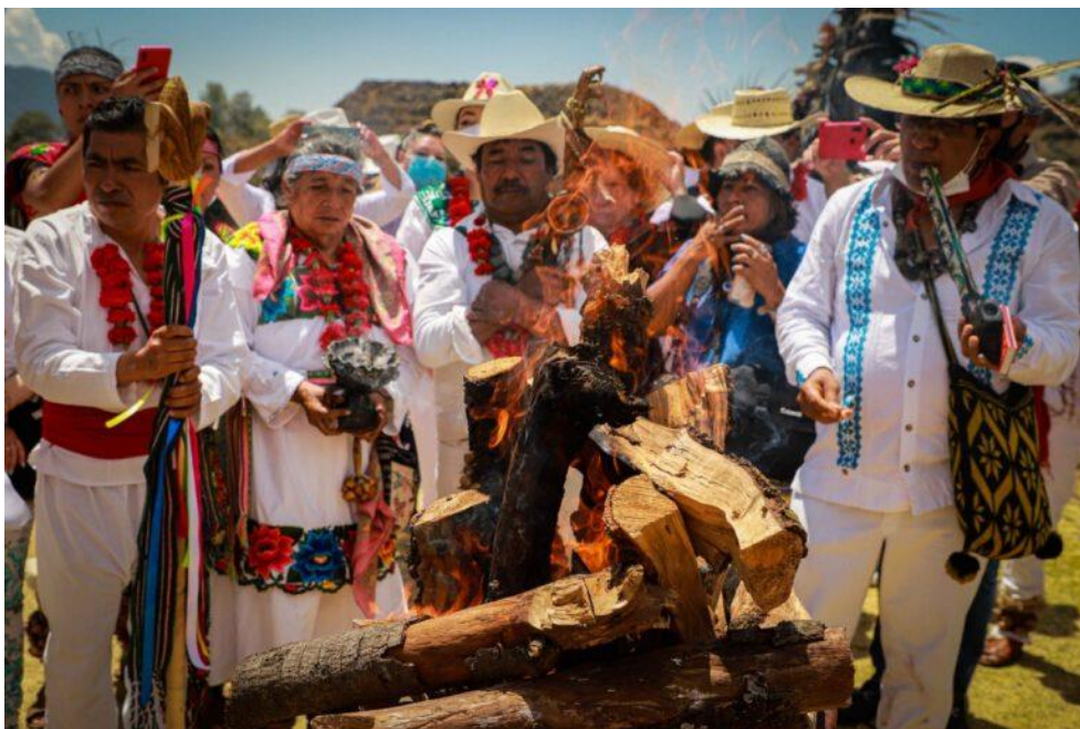
Imagen 5. Ceremonia realizada durante el Festival del Quinto Sol

Y es que, no obstante, el paso del tiempo, Huamango, sigue funcionando como un importante centro ceremonial. Las festividades, envueltas ahora en un aire de sincretismo, se constituyeron desde 1987 en el llamado Festival del Quinto Sol, evento celebrado en torno al equinoccio de primavera, durante el cual, los pueblos originarios de la zona, otomíes, mazahuas, nahuas y tlahuicas, principalmente, siguen preservando sus tradiciones y cosmovisión, a través de ritos, danzas, ofrendas y eventos culturales. Este festival también tiene una sede alterna en la zona arqueológica de Teotenango.