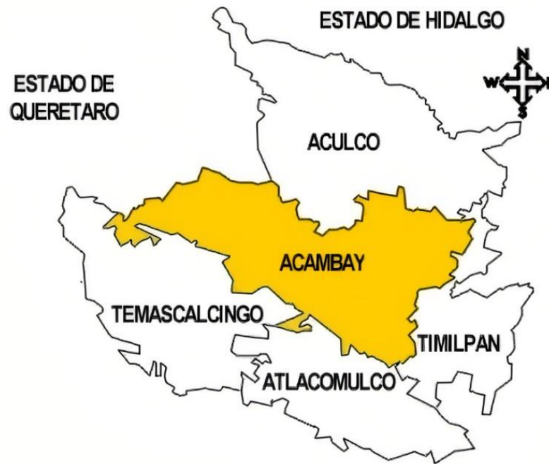
Imagen 1. Ubicación del municipio de Acambay.

En aquella época, Huamango se consolidó como un importante centro social y económico en la región, el cual dominaba el valle de Acambay y toda su periferia. Enclavada en la Ruta de la Sal; en esta ciudad se comerciaba con plumas, obsidiana, maíz, arcos y flechas. Su riqueza y poderío fue tal, que, para librar los ataques de otras tribus, se edificó una muralla, la cual convirtió a Huamango en un importante bastión militar, dada su altitud y ubicación estratégica. De notable influencia Tolteca, dada la cercanía con Tula, Huamango tuvo una gran interacción con otras importantes poblaciones, hoy cercanas a la ciudad de Toluca, como Teotenango, otra imponente ciudad amurallada, y Calixtlahuaca, sitio arqueológico cuyo templo dedicado a Ehécatl-Quetzálcoatl, es una bellísima pirámide circular, única en su tipo.