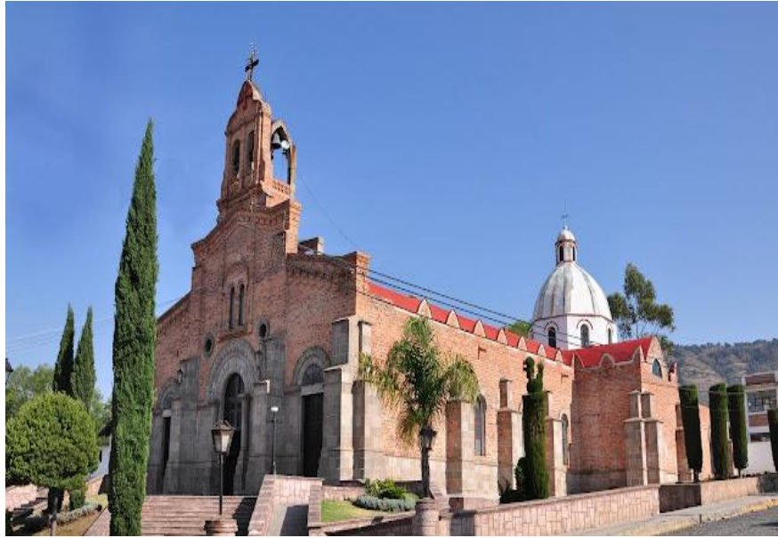
Imagen 8. Parroquia de San Miguel Arcángel.

Otra de las particularidades de la zona, es la llamada Falla de Acambay, una falla geológica que obligó a los habitantes de Huamango a desplazarse a Dongú, donde también construyeron un centro ceremonial y que posteriormente los obligaría a reubicarse nuevamente, pero ahora en las inmediaciones de la actual Acambay.