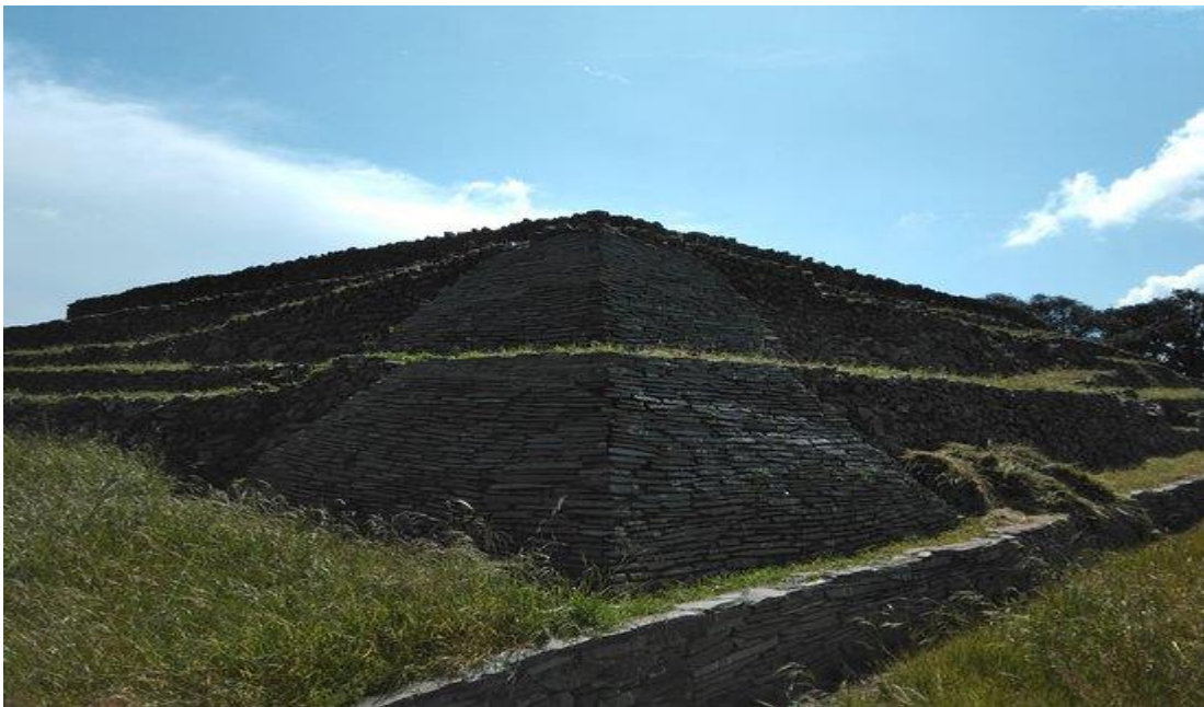
Imagen 2. Vista de uno de los edificios de Huamango donde se aprecia el revestimiento de lajas cuatrapeadas.

Edificada sobre terrazas, dada la irregularidad de su terreno, fue necesaria también la construcción de muros de retranqueo, los cuales sirvieron además de muralla al alcanzar incluso hasta 2 metros de altura en algunas zonas del conjunto urbano. Huamango cuenta con notables edificios religiosos, los cuales fueron realizados con piedra unida con lodo y revestidos con lajas cuatrapeadas, entre los que destacan el llamado Palacio y el Templo del Guerrero.