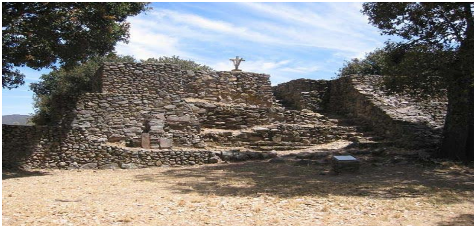
Imagen 4. Basamento hoy conocido como El Altar, con una cruz católica en su cima.

A unos pasos del sitio arqueológico, durante la época colonial, edificada con piedras de las propias pirámides, los franciscanos que evangelizaron la región construyeron una capilla que aún se encuentra en pie, y donde todavía se venera a Miguel Arcángel. Además, la celebración de la Santa Cruz congrega a numerosas personas, quienes cada 3 de mayo realizan ceremonias religiosas en esta capilla, para lo cual llevan flores y veladoras. Otro ejemplo de sincretismo religioso, es el hecho de que se haya colocado una cruz sobre el templo conocido hoy como El Altar.