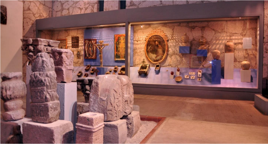
Imagen 6. Interior del Museo Regional de Cultura Otomí.

El centro de Acambay, destaca por su plaza principal, en la cual se ubica un hermoso reloj monumental, culminado en 1938. Los murales al interior del palacio municipal son también una parada obligada al visitar el lugar, que cuenta también con una hermosa parroquia dedicada a Miguel Arcángel, y que fue edificada por los franciscanos en 1691.