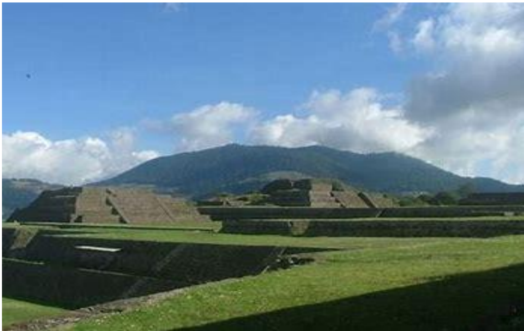
Imagen 3. Vista parcial de Huamango, en ella se aprecian las terrazas sobre las cuales fue edificada.

En lo concerniente al Área Residencial, en su mayor parte aún inexplorada, se construyeron una serie de plataformas sobre las cuales se levantaban los recintos habitacionales de los señores del lugar.