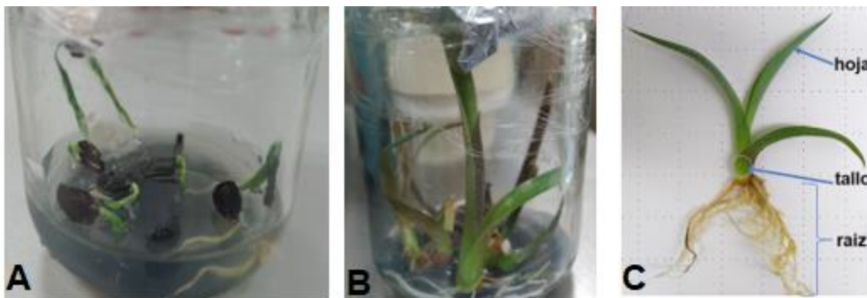
Figura 1. Obtención de explantes para la expresión embriogénica directa en A. cupreata . A) Semillas germinadas a los 15 días. B) Plántula a las 12 semanas después de la germinación. C) Explantes de hoja, tallo y raíz.

Para la etapa de IMPE el experimento consistió en un diseño completamente aleatorizado con arreglo trifactorial (explante x complejo vitamínico x 2,4-D) (3x5x2), con tres repeticiones para cada factor. En la fase de expresión de embriones somáticos directos (EESD) el experimento tuvo un diseño completamente al azar con tres repeticiones por cada concentración de AIA. Para todos los casos los datos obtenidos se sometieron a un análisis de varianza seguido de una prueba de Tukey ( P \leq 0.05 ) utilizando el paquete estadístico InfoStat, versión 2017.