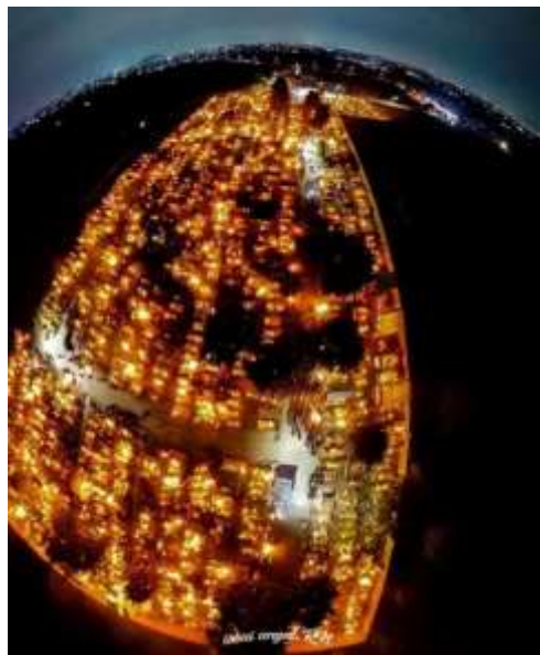
“La tierra del descanso eterno” Fotografía capturada del panteón de San Miguel Totocuitlapilco durante la velada por el día de muertos con un dron por Nava (2022).

Este año de acuerdo con algunos comentarios escuchados en el panteón los residentes se conmocionaron al notar que hubo un gran movimiento de personas a comparación de años anteriores.