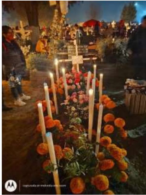
Trabajo de campo 2022: Fotografía de una tumba durante la velada 2022 en San Miguel Totocuitlapilco,

pueden velar en dos lugares diferentes: la parroquia de San Miguel Arcángel y el panteón de San Miguel Totocuitlapilco.