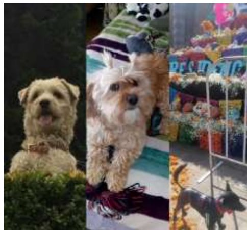
(2024): Enrique, Mimi y Xolo.