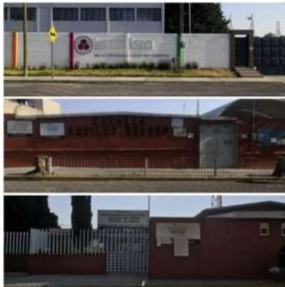
Trabajo de campo 2023; Instituto Roerich, Primaria Aquiles Serdán, Jardín de niños Miguel Alemán: centros educativos en San Miguel Totocuitlapilco.