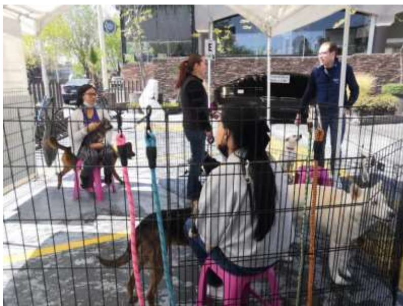
Trabajo de campo 2023: Feria de adopción en plaza Izar, Metepec.

Ahora bien, el proceso de adopción consiste en seis pasos: uno; los activistas deben ubicar el lugar de residencia donde vivirá el canino o felino, dos; se debe firmar un convenio de adopción entre ambas partes (adoptantes y la organización), tres; se debe dar una aportación de $500 MXN que no es considerada una venta, sino un donativo para pagar gastos de la ONG y que esta pueda continuar con su labor altruista, cuatro; se deben entregar ciertos documentos (INE y comprobante de domicilio), cinco; se debe evaluar la relación entre menores de edad y caninos o felinos (esto para prevenir accidentes o alergias) si es que hay niños de por medio, seis; evaluar la convivencia con mascotas (en caso de contar con más).