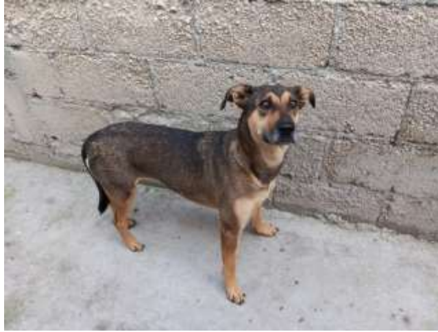
Trabajo de campo 2024: Bombón. Familia López Iturbe.