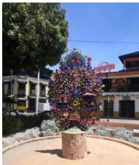
Trabajo de campo 2023: Árbol de la vida ubicado en la fuente de la tlanchana, Metepec.

Sin embargo, también se encuentran minuciosos acabados realizados dependiendo la temática, por ejemplo, la representación de la muerte a través de calaveras en un diminuto tamaño que conforman el árbol. A este tipo de árboles se les llama árboles temáticos, no de la vida. El árbol de la vida es considerado patrimonio cultural de México.