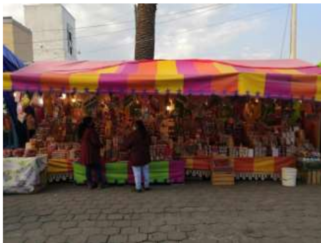
Trabajo de campo 2022: Puesto "Dulcería Ramírez" en la feria de San Miguel Arcángel, San Miguel Totocuitlapilco

Ofrecen variedad de dulces, tanto tradicionales como dulces clásicos que se pueden encontrar en una tienda comercial, pero hay algo que hace la diferencia y es que las palabras de la comerciante fueron las siguientes: "Desafortunadamente o afortunadamente somos parte de una cadena de negocios, la economía necesita moverse, por ello les invitamos a los pobladores vengan a consumir nuestros productos" (Septiembre, 2022).