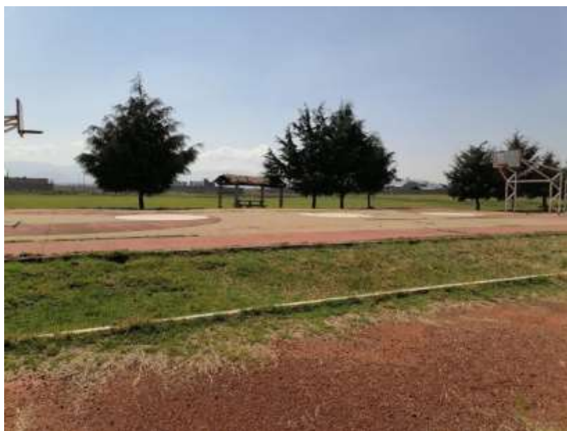
Unidad Deportiva San Miguel Totocuitlapilco, fotografía tomada del usuario de Facebook "Gusso Deport" (2022).

Acceder a la biblioteca tenía un costo de $5.00 MXN o la entrada era gratis si eras socio o familiar de algún socio.