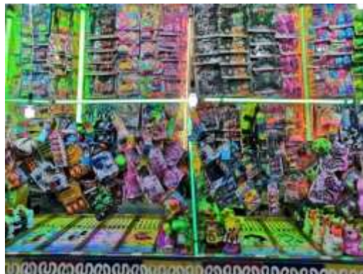
Trabajo de campo 2022: Puesto de juego de canicas en la feria de San Miguel Arcángel, San Miguel Totocuitlapilco

Hace siete años que es uno de los varios puestos dedicados al juego de canicas establecidos dentro de la feria de San Miguel Totocuitlapilco. En este juego podrás ganar algún premio como por ejemplo alcancías, juguetes, artículos de papelería, entre otras más. El comerciante comentó que siente afecto al volver a la feria de San Miguel Totocuitlapilco y mandó un mensaje a la población: "¡Señores échenle ganas! Para que traigan a sus chavitos a divertirse" (Septiembre, 2022).