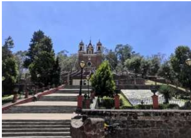
Trabajo de campo 2023: Templo del Calvario, Metepec.

El Calvario y la parroquia de San Juan Bautista son los dos templos más destacados y visitados, pero también de las construcciones más antiguas del lugar.