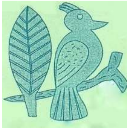
Escudo de San Miguel Totocuitlapilco

Del náhuatl “Tototl”, cuyo significado es “En la cola del pájaro”.