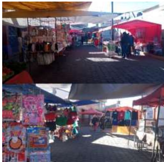
Trabajo de campo 2024: Tianguis del día domingo. San Miguel Totocuitlapilco

El tianguis permite que residentes de San Miguel Totocuitlapilco puedan ofertar sus productos, así como también personas de otros lugares, de igual manera la población totocuitlapilquense consume dichos productos y personas que visiten el tianguis, se genera el apoyar una economía local. Existe un comité integrado actualmente por pioneros que impulsaron el establecimiento del tianguis; el cual tiene como función establecer las reglas a seguir para que las personas puedan colocar su respectivo puesto.