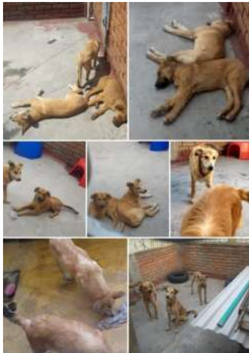
Los tres hermanos. (2023).

“Me preocupa más que ellos tengan comida a que yo tenga que comer”. “Son parte de mi mundo. Iluminan mi día. Son la razón por la que uno va a trabajar” (Entrevista realizada a Hilda, diciembre, 2023).