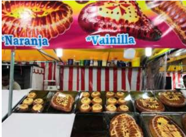
Trabajo de campo 2022: Puesto de pan en la feria de San Miguel Arcángel, San Miguel Totocuitlapilco,