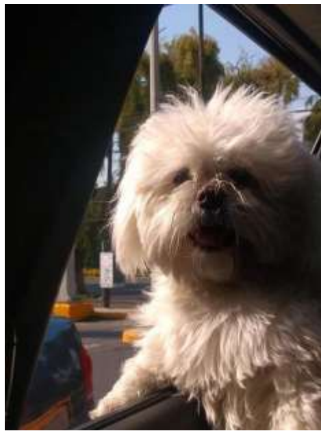
Coco. (2023).

Le tengo un cariño enorme... Ehh... Siento su compañía, su calor de su cuerpo porque a veces me pongo a pensar o sea, no habla, no hace nada, pero tú lo sientes y es un ser vivo, sientes su corazoncito, como se menea y sabes que está ahí para ti, o sea, no sé... Es bonito, es un tipo de amor distinto (Entrevista realizada a Getsemani, diciembre, 2023).