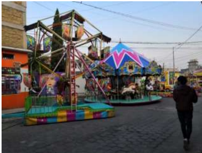
Trabajo de campo 2022: Juegos mecánicos en la feria de San Miguel Arcángel, San Miguel Totocuitlapilco

En la tarde del 28 de septiembre también llegaron a instalarse comerciantes que forman parte de la tradicional feria de San Miguel Arcángel, dedicados algunos a la venta del pan, de dulces típicos, de novedades, de juegos de canicas, juegos de pesca, entre otros, además de los juegos mecánicos que son destacados durante la celebración. Cabe mencionar que la feria se ubica en la calle Independencia, esquina calle Miguel Hidalgo hasta la esquina de la calle Zaragoza; abarcando tres cuadras.