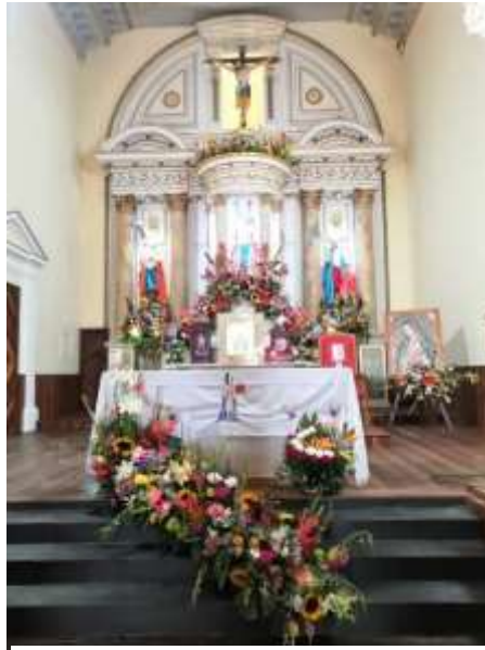
Trabajo de campo 2022: Altar de San Miguel Arcángel “el patrón” en la Parroquia de San Miguel Arcángel, San Miguel Totocuitlapilco.

Para los residentes católicos de San Miguel Totocuitlapilco una función determinante que realizó San Miguel Arcángel es la de haber peleado contra Satanás, derrotándolo y logrando un bien mayor.