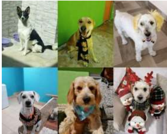
(2023): Arriba: Sully, Mapache, Toby. Abajo: Pingo, Peluche, Moyis.