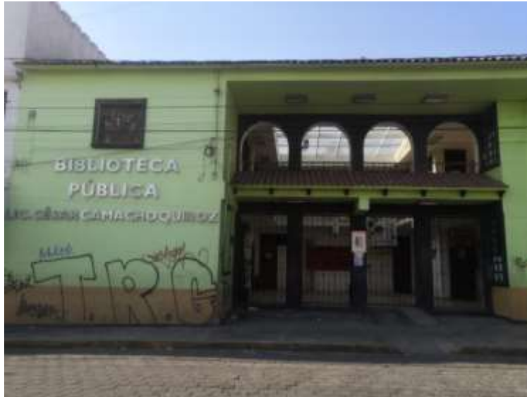
Trabajo de campo 2023: Biblioteca Lic. César Camacho Quiroz, San Miguel Totocuitlapilco

años que no pudieron estudiar o continuar con sus estudios. En el segundo piso se encuentra la biblioteca y ahí mismo se imparte un taller de costura. Las tres actividades se encuentran abiertas a todo público y buscan beneficiar a la comunidad.