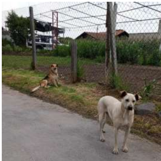
Trabajo de campo 2023; Paloma y Mordiscos.