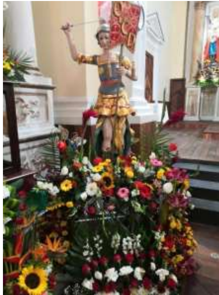
Trabajo de campo 2022: San Miguel Arcángel “el peregrino” en la Parroquia de San Miguel Arcángel en San Miguel Totocuitlapilco

con música. “En la parroquia el patrón se queda y sacan al peregrino que estará presente en todas las celebraciones...” Se dice entre las personas.