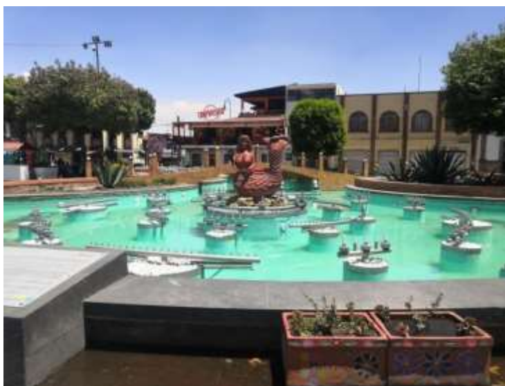
Trabajo de campo 2023: Fuente de la tlanchana, Metepec.

Se decía que detrás de los tules y hierbas de la laguna, sobre un islote podía verse a una hermosa mujer desnuda ataviada con corona y collares y sartas de peces, acociles y ajolotes en la cintura. La sirena de Metepec poseía un temperamento posesivo, voluble y vengativo; si estaba contenta, su cola era la de una serpiente negra, y permitía a los pescadores obtener abundante pesca con sus redes. Cuando se enamoraba de algún humano podía convertir su cola en piernas y salir a tierra a buscarlo; si un hombre no atendía su melodioso llamado utilizaba la cola de serpiente para rodearlo y arrastrarlo al fondo de sus dominios hasta que lo ahogaba. Con el paso de los siglos las lagunas se secaron.