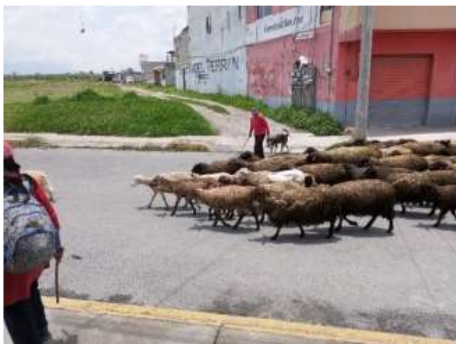
Trabajo de campo 2023; pastoreo en San Miguel Totocuitlapilco.

Se presenta un proceso de reciprocidad pues los caninos ayudan a los humanos con el cuidado de sus rebaños y los humanos integran a su vida y en su cotidianidad a los caninos, además de alimentarlos.