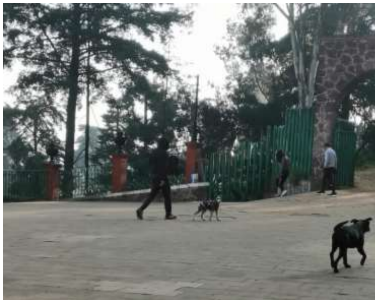
Trabajo de campo 2023: Calvario, Metepec.

Perros de diferentes razas, algunos ejemplares: Chihuahua, Gran Danés, Pastor Belga, Schnauzer y algunos mestizos. Un sábado se observó un ejemplar mestizo de color negro que no tenía dueño pues se dedicaba a seguir a las personas que se encontraban en el lugar; pese a eso las personas le acariciaban o sonreían, pero el perro permaneció todo el tiempo al lado de la Capilla, se ha fomentado una conciencia en las personas de no atacar al animal canino y esto genera un nuevo asunto: se trata de aquellas organizaciones no gubernamentales dedicadas a la salvaguarda y protección de los animales caninos; punto que será desarrollado a continuación.