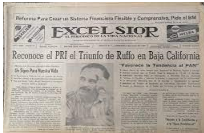
Figura 1. Primera gubernatura perdida por el PRI, en 1989.