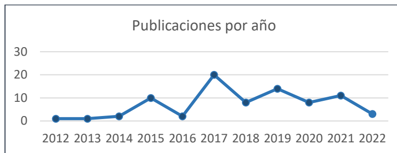
Gráfico 1. Artículos por año