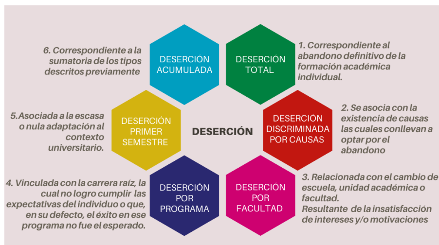
Figura 2. Categorías de deserción