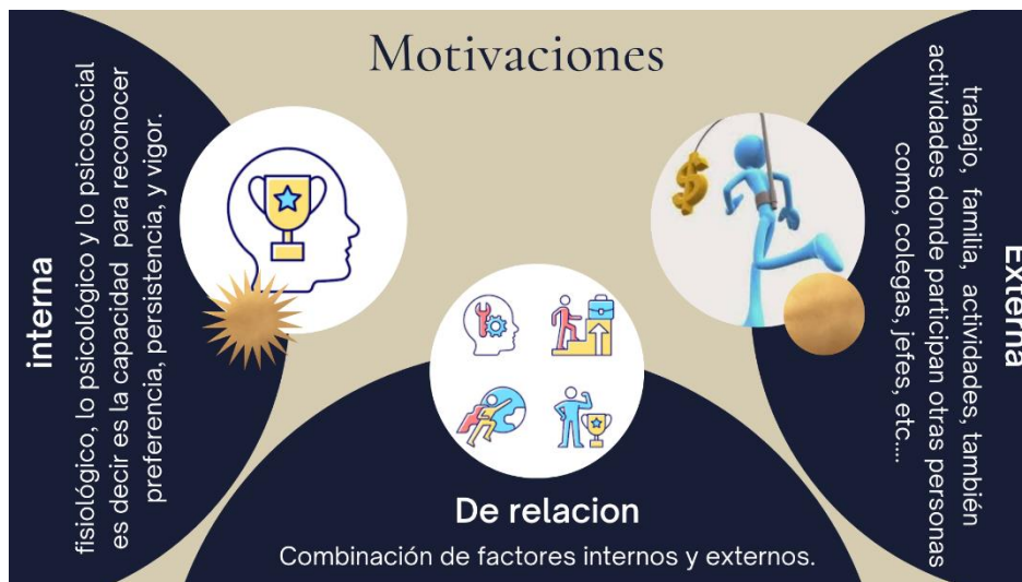
Figura 3. Tipos de motivaciones en los estudiantes