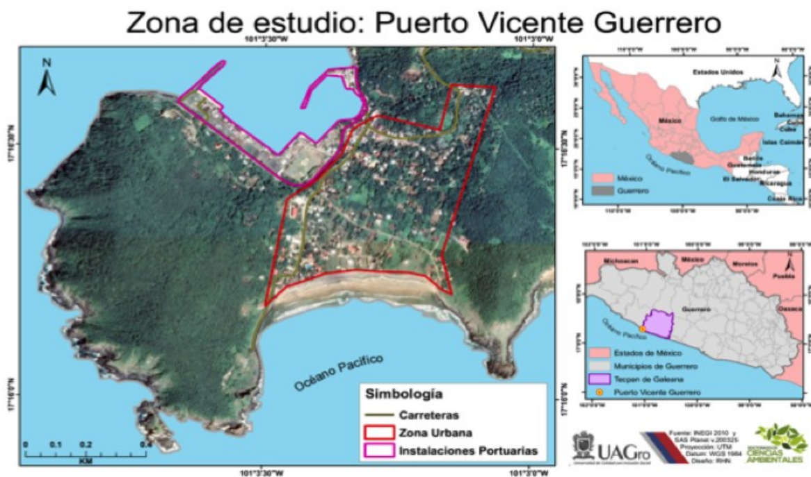
Figura 1. Infraestructura del Puerto Vicente Guerrero, Municipio de Tecpan, Guerrero, México

Puerto Vicente Guerrero se encuentra en el municipio de Tecpan de Galeana, en el estado de Guerrero, a una altitud de 71 metros sobre el nivel del mar. Sus coordenadas geográficas son Longitud: 17° 16' 13", Latitud: -101° 03' 22". La localidad se ubica a 48 kilómetros de la ciudad de Tecpan de Galeana, en dirección norte hacia Ixtapa-Zihuatanejo, a una distancia de 87 kilómetros de esta última (Figura 1). El nombre "Puerto Escondido" se debe a su peculiar ubicación, enclavada entre el mar y las montañas (Giovannelli, 2009) (ver Figura 1). La población de la localidad es de 413 habitantes, con un 50.84% de hombres y un 49.16% de mujeres, distribuidos en 207 viviendas según datos del INEGI en 2010.