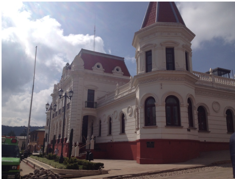
Fotografía No. 2 Palacio Municipal

El 5 de Febrero de 1907, durante una gira de trabajo el gobernador del estado, el General Fernando González puso la primera piedra para el nuevo palacio municipal, tuvo un costo de 87 mil 665 pesos con 50 centavos, la obra duró tres años siete meses y fue puesta en funcionamiento el 2 de octubre de 1910. En 1976, el inmueble fue remodelado en sus techos e interiores, con excepción del salón de los cabildos y de los torreones, sustituyéndolos por techos de bóvedas catalana, los cuales aún se conservan, además se entregó casi concluida la escalera interior que comunica al salón de los cabildos. Entre 1979 y 1981 el remozamiento del pórtico principal y el de la parte norte, así como la decoración interior del salón de los cabildos y de las oficinas hasta lograr la estructura actual (González, 2003), (Véase Fotografía No. 2).