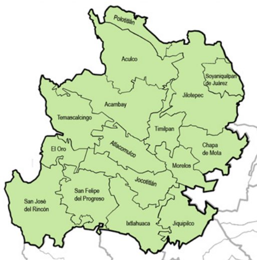
Imagen No.1 Región II Estado de México