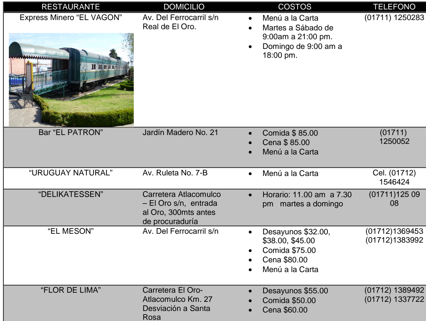
Tabla No. 2 Restaurantes, antojitos y fondas.