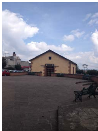
Fotografía No. 4 Casa de las artesanías

conservas, muebles rústicos, souvenirs, postales y la bebida tradicional “la chiva” (Secretaría de Turismo, 2013), (Véase Fotografía No. 5).