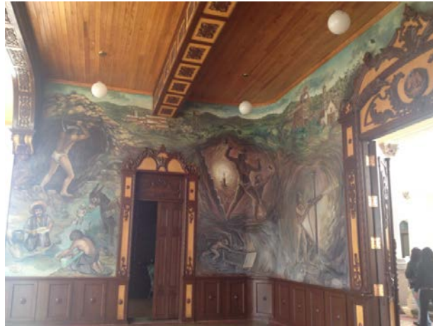
Fotografía No. 3 El Génesis Minero

mural reciente, intitulado “El Génesis Minero”; en el interior, en el Salón de los Cabildos, se puede apreciar la ornamentación original que todavía se conserva (Secretaría de Turismo, 2013), (Véase Fotografía No. 3).