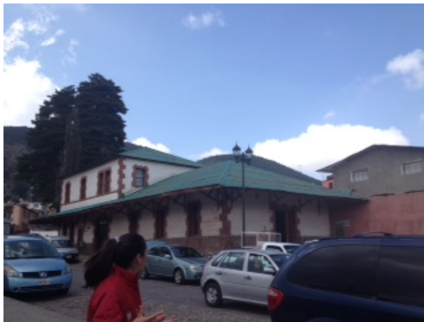
Fotografía No. 4 Estación del tren

La estación de tren recibía y transportaba a los pasajeros, carga de mercancías y todo lo relacionado a la minería, constituyendo un lugar de bastante movimiento ciudadano en la época minera. El turista actualmente puede observar esta construcción que en esa época era necesaria para transportar el preciado mineral (Secretaría de Turismo, 2013), (Véase Fotografía No. 4).