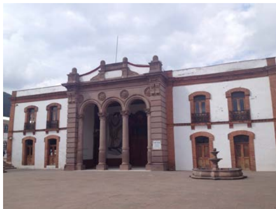
Fotografía No. 1 Teatro Juárez

Los trabajos de este edificio fueron iniciados en febrero de 1906 y se concluyeron 12 meses después, esta construcción tuvo un costo de 37 mil pesos. Fue inaugurado en 1908. Durante 1910 se dieron cita los mejores exponentes del arte en todas sus manifestaciones. Entre enero y junio de 1938 se remodeló totalmente el inmueble, además se construyó una cabina de concreto para proteger el equipo cinematográfico, durante la década de los años 80, fue dotado de camerinos individuales y colectivos, se creó una bodega, un sótano y se actualizó el área de la tramoya. Actualmente cuenta con moderno equipo de iluminación y audio con una dimensión aproximada es de 2200 m 2 además la fachada de piedra es en estilo neoclásico (Véase Fotografía No. 1). En las paredes interiores cuenta con ornamentación vegetal en dorado de estilo art nouveau y salones en madera tallada (Secretaría de Turismo, 2013; González, 2003). El IMC coordina los eventos que se realizan, no tiene cuotas de acceso y el horario es de 9:00 a 14:00 horas, sin embargo, los días de evento cierran más tarde como la grabación del programa de Televisa Una noche con Yuri, así como el Primer Festival de Voz Mexiquense al Viento (Véase Anexo No. 4).