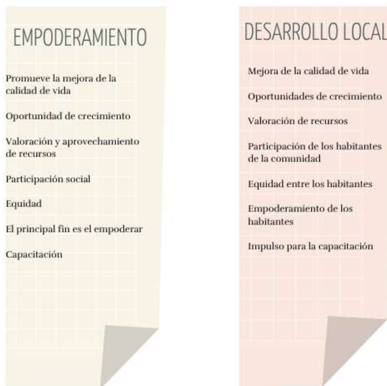
Tabla 2: Elementos que comparten el empoderamiento y el desarrollo local

Fuente: Elaboración propia con base en (Franco, I; Pérez-García, A, 2020; Burgos, R; Cardona, M, 2015; Ontiveros, M; Carrillo, M, 2015)