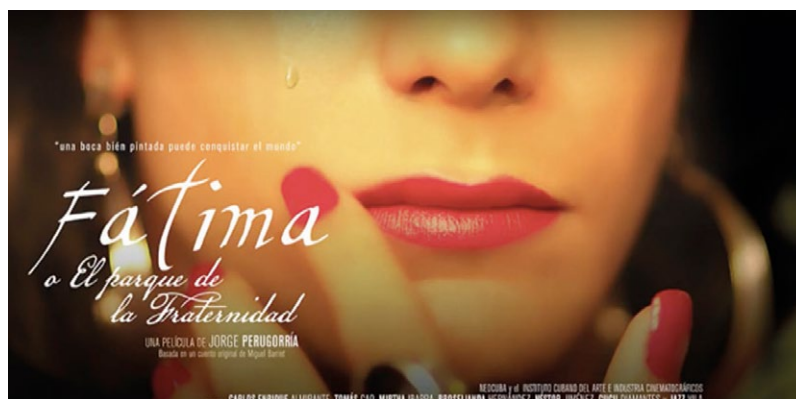
Imagen 1. Cartel publicitario de la película Fátima o el Parque de la Fraternidad (John G. Avildsen, director; Ernesto Granado, fotografía).

la mesa comiendo con su madre y adquiere una postura femenina, llega el padre y lo critica, la madre entra en su defensa y termina golpeada severamente; el segundo es más terrible todavía, el padre ha visto a Manolito, ya adolescente, cabalgar junto con un chico, ambos van con el torso desnudo y el protagonista va abrazando el torso de su acompañante tanto para sostenerse en el caballo como para disfrutar del contacto con la piel del joven, el padre se enfada al mirar esta escena; posteriormente, cuando la madre organiza una fiesta de cumpleaños para el protagonista, irrumpe en la convivencia y termina por darle una paliza a Manolito. En esta segunda escena, el protagonista no sucumbe ante el padre y lo golpea también; este acontecimiento será el que detone en buena medida la salida de Madruga de Manolito y su traslado a La Habana.