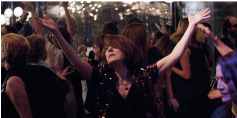
Imagen 11. Gloria baila en solitario.

Es importante notar que no es la primera vez que Leilo emplea el baile y la música como una estrategia de escape. En Gloria , la protagonista encuentra en él un refugio de la rutinaria realidad (imagen 11), una que, basada en constructos sociales restrictivos sobre la edad y la feminidad, la desexualiza y le niega el derecho al placer sobre su propio cuerpo. Nótese la similitud entre las imágenes 10 y 11, donde ambas protagonistas se presentan en primer plano como mujeres libres que agencian su propia realidad al bailar. Las dos optan por el baile como espacio de contestación de las lógicas normativas de ser y sentir.