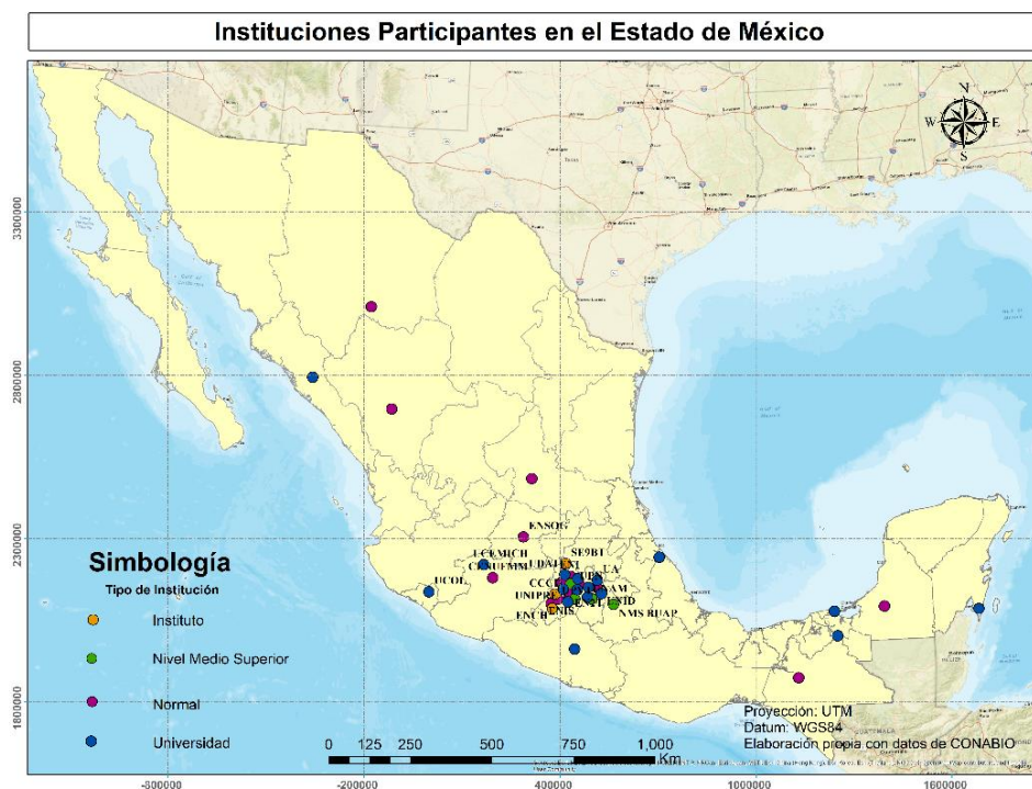
Figura 4. Mapa de instituciones participantes en el II CIIE 2018.