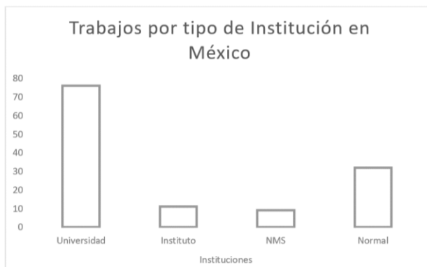
Figura 2. Número de trabajos por tipo de institución en México.

Resulta interesante analizar el tipo de institución desde la cual se realizaron las investigaciones que se presentaron en el II CIIE, lo cual se representa en el siguiente gráfico.