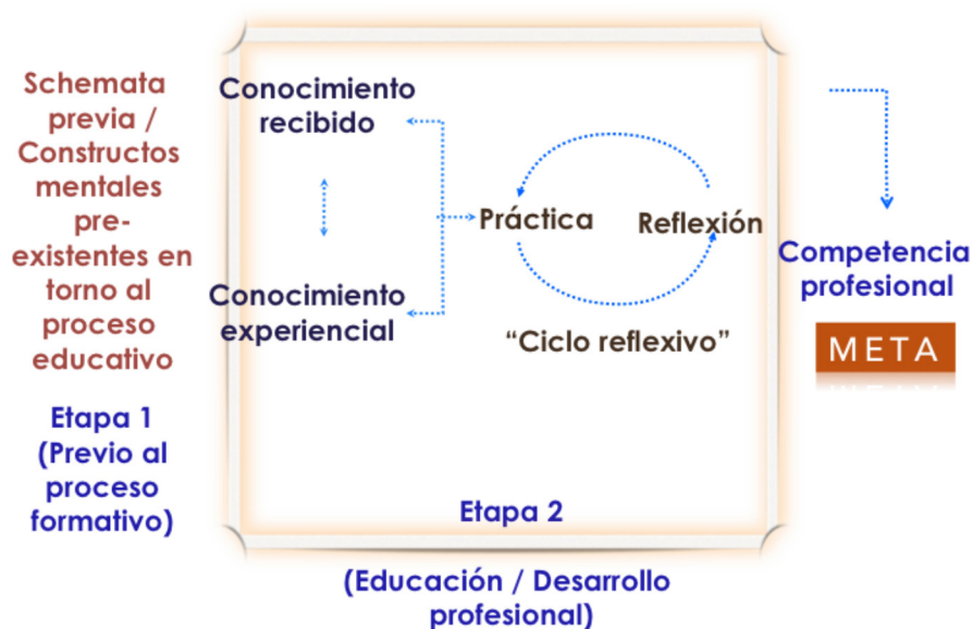
FIGURA 1. Modelo Reflexivo de Formación Docente y Desarrollo Profesional.

exploración de los constructos mentales que el estudiante aporta desde el inicio y a lo largo del curso. Es a partir de esas estructuras que el educador promueve procesos cognitivos para la adquisición de conocimiento teórico-metodológicos, pero éstos se articulan y sustentan con prácticas reflexivas, de introspección continua y de toma de conciencia acerca de la intervención en el contexto educativo.