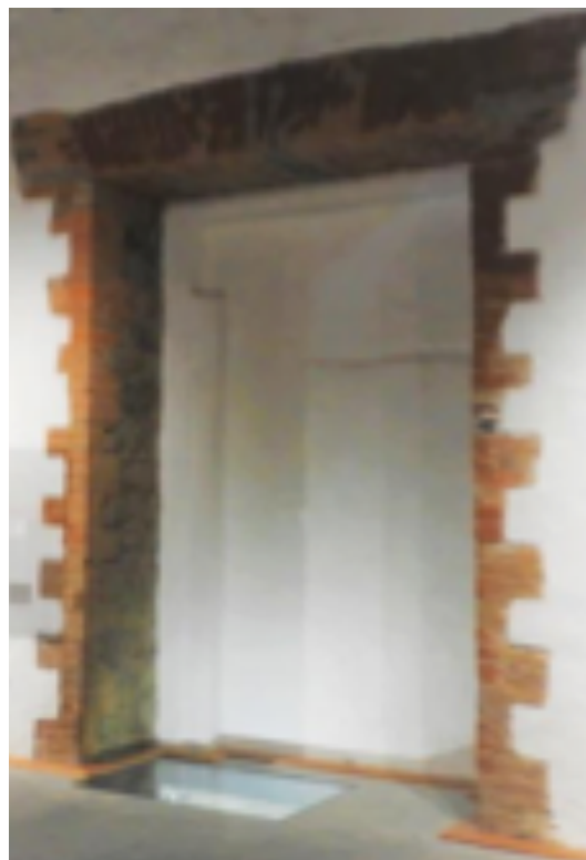
Imagen 5. Vestigios expuestos con un ribete natural, y ventana arqueológica en el piso (Espinosa M. 2019).

Trabajos en muros históricos. En la crujía oriente, debajo del torreón oriente, se realizó la liberación de material contemporáneo en los paramentos y con ello se detectó una adaraja en la parte superior de uno de los muros que suponía la existencia de un antiguo muro, después de este vestigio se fueron descubriendo múltiples arcos antiguos pertenecientes a edificaciones anteriores de épocas cronológicas contemporáneas a los antiguos cimientos. Una vez retirado todo el material existente en los muros, se comenzó la aplicación de mortero de cal en las crujías, con cal reposada de seis meses y mucilago de nopal de más de dos semanas de hidratación, el repellido de mortero de cal, permitió resanar oquedades en los muros y se dejó un ribete perimetral en los vestigios, tales como puertas, ventanas, arcos antiguos y dinteles originales (Imagen 5).