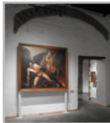
Imagen 8. Fotografía de la Obra “La caída de los Ángeles Rebeldes” expuesta en la Pinacoteca (Espinosa M. 2019).

“La Caída de los Ángeles Rebeldes (1850) (Imagen 8), autoría de un joven pintor mexicano que entonces contaba con 26 años, Felipe Santiago Gutiérrez (1824-1904) (Alegre, S.F.), cuyos pinceles interpretan un poema del siglo XVII, al parecer de Jhon Milton (1608-1674), que se denominó “Paraíso Perdido”, en este caso una pintura ilustra un poema (INBAL, 2017).