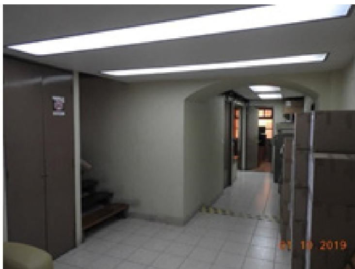
Imagen 1. Oficinas instaladas originalmente en el espacio a reciclar (Morales M.A. 2019).

Descripción del espacio anterior. Estaba integrado por dos crujías que contenían un mezzanine, cinco cubículos, tres bodegas de papelería y una de jardinería, dos sanitarios en desuso, un área de cómputo y un vestíbulo de acceso (Imagen 1).