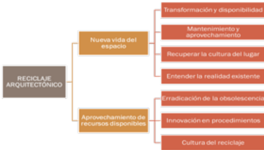
Diagrama 2. Metodología de Reciclaje Arquitectónico (Interpretación de Espinosa M. 2019).

La metodología del reciclaje arquitectónico aplicada, es una compilación del trabajo e investigación internacional, cuyas bases ideológicas se presentaron recientemente en Valencia, España (Navarro, 2016). En este trabajo se marcan distintas y trascendentes estrategias como las de renovar los espacios de forma científica y técnica; también subraya evitar el derroche de toda clase de recursos naturales, humanos, patrimoniales, económicos e históricos (Navarro, 2016) (Diagrama 2).