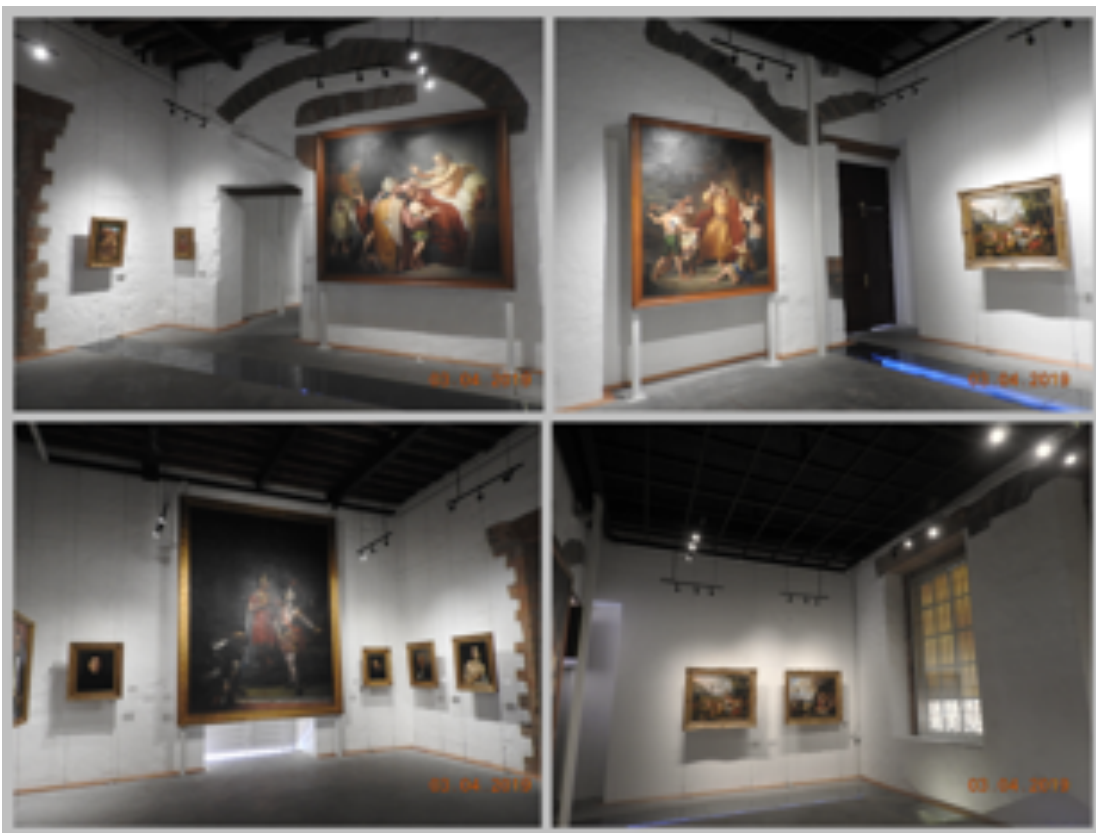
Imagen 7. Fotografías de la culminación de la Pinacoteca Universitaria donde se muestra la relación del espacio arquitectónico con la obra pictórica, el reciclaje y la conservación del Patrimonio (Espinosa M. 2019).

Esta obra, junto con los trabajos del Centro de Documentación Presidente Adolfo López Mateos y el Museo de Historia Natural que se encuentran en la misma ala norte de la planta baja del Edificio de la Rectoría, son proyectos realizados recientemente por el Departamento del Conservación del Patrimonio Histórico Arquitectónico de la UAEMÉX, además, son las primeras obras en Toluca que exhiben dentro del reciclaje, ventanas arqueológicas que permiten observar y tener a la vista hallazgos arqueológicos y estructuras arquitectónicas que permiten al espectador una regresión en el tiempo para la valoración del patrimonio.