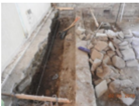
Imagen 2. Material arqueológico arquitectónico localizado en el subsuelo, perteneciente a una edificación anterior al edificio de la Rectoría (Morales M.A. 2019).

Inicio de trabajos. El espacio se desmanteló, liberando al inmueble histórico de elementos contemporáneos o invasivos, las demoliciones fueron mediante medios manuales y artesanales con maceta, cincel y barreta. Se prohibió el uso de medios mecánicos o neumáticos para demoler cualquier elemento. Durante la remoción del piso se empezaron a localizar vestigios históricos y arqueológicos; una acequia, un par de cimientos de gran tamaño en el sentido transversal, respiraderos exteriores y unas mojoneras localizadas en dos ejes, estas estructuras pertenecían a una edificación anterior, a la época del Virreinato y al siglo XIX (Imagen 2).