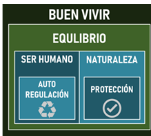
Diagrama 1. El Buen Vivir (Espinosa M., 2019).

El Buen Vivir propone el bienestar y equilibrio entre las sociedades y la naturaleza; detener el consumo desmesurado de productos para evitar agotar los recursos de los ecosistemas y frenar la producción de residuos que no podemos reutilizar o reciclar (Diagrama 1). Se requiere una nueva ética que nos permita orientar y razonar nuestras acciones para respetar toda forma de vida. Se necesita compromiso de parte de los seres humanos para evitar nuestra destrucción, en pocas palabras, auto regulación.