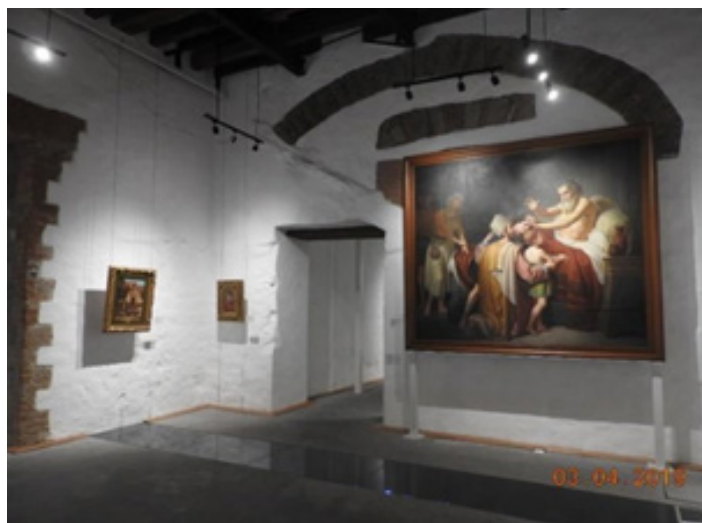
Pinacoteca de la UAEMéx.