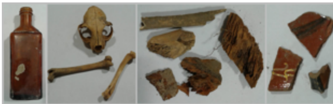
Imagen 3. Material arqueológico de diversas épocas, localizado en el subsuelo, vidrio, huesos, maderas y cerámicas (Espinosa M. 2019).

El retiro de la tierra de alrededor de éstas, se realizó cuidadosamente mediante un tamizado del material de relleno, pues era posible que se recuperara material arqueológico, de varios siglos, lo cual sucedió: se localizaron huesos de animales, así como cerámica, madera y botellas de vidrio (Imagen 3).