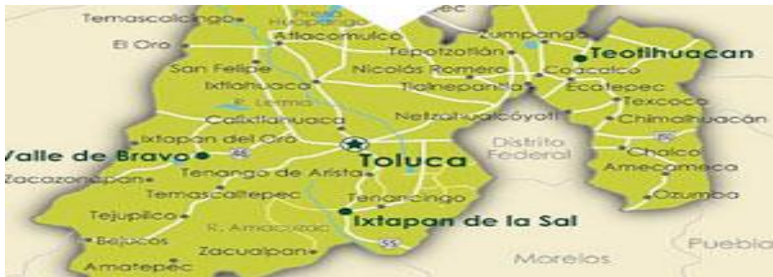
Imagen 1. Municipios del Estado de México. (Gobierno del Estado de México, 2019)

La siguiente imagen representa los municipios que integran el Estado de México