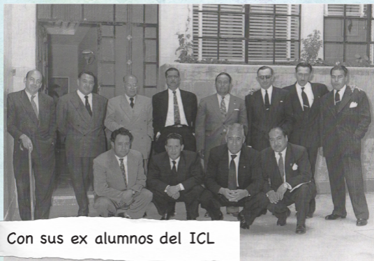
Con sus ex alumnos del ICL