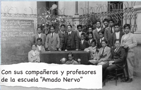
Con sus compañeros y profesores de la escuela "Amado Nervo"