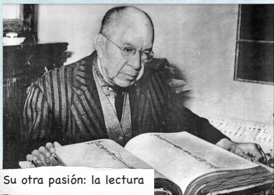
Su otra pasión: la lectura

De 1929 a 1933 imparte una cátedra en el Instituto Científico y Literario del Estado de México. A partir de su salida, se dedica