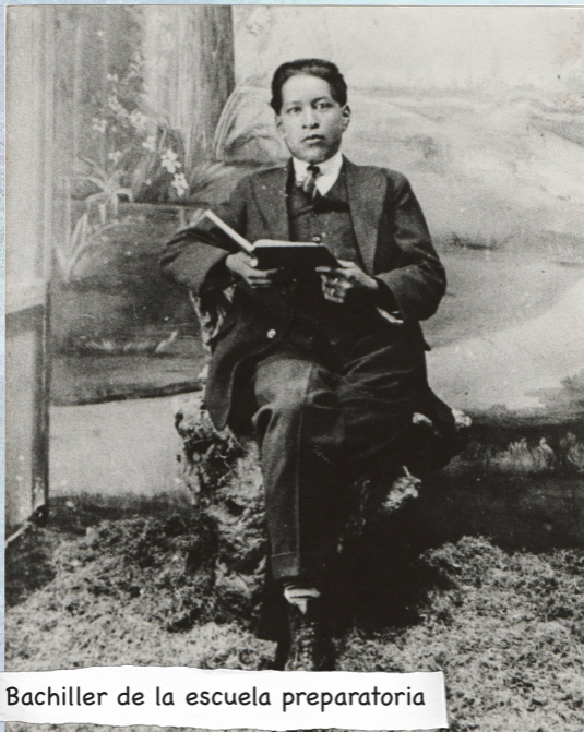
Bachiller de la escuela preparatoria

Iniciando el siglo XX, en un pueblo triste y huraño bañado por los ríos Jalatlaco y San Juan, que formaban la zona lacustre del valle de Chiconahuapan y que lleva el nombre de Capulhuac Villa de Mirafuentes, en el Estado de México, el 10 de julio de 1901 nació un niño que sería conocido como el poeta campesino: Arnulfo Lorenzo Genaro Robles Barrera.